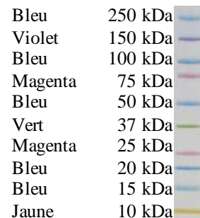
Tableau: Masse moléculaire des marqueurs protéiques du Kaléidoscope